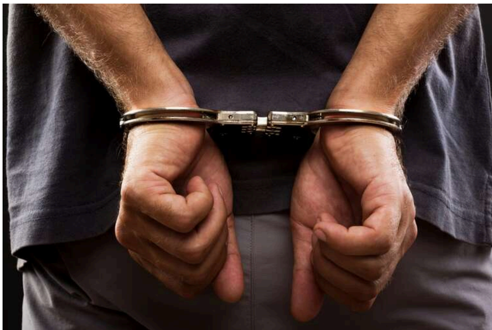
У Києві затримали жінку, яка підозрюється у серії крадіжок у ювелірних магазинах

Слідчі та оперативники Святошинського управління поліції Києва разом із детективами карного розшуку затримали 32-річну мешканку столиці, яка систематично обкрадала ювелірні крамниці в торговельних центрах різних районів міста. Нещодавно столична поліція вже фіксувала крадіжку золота - тоді 58-річний іноземець намагався винести ювелірні прикраси і потрапив прямо в руки правоохоронців. Цього разу зловмисниця діяла під виглядом покупниці: просила показати коштовні вироби, а потім ховала ланцюжки й каблучки до кишені верхнього одягу та спокійно залишала магазин. Правоохоронці встановили щонайменше п'ять епізодів злочинної діяльності, а жінці висунуто підозру за статтею про крадіжку в умовах воєнного стану - їй загрожує до восьми років позбавлення волі.