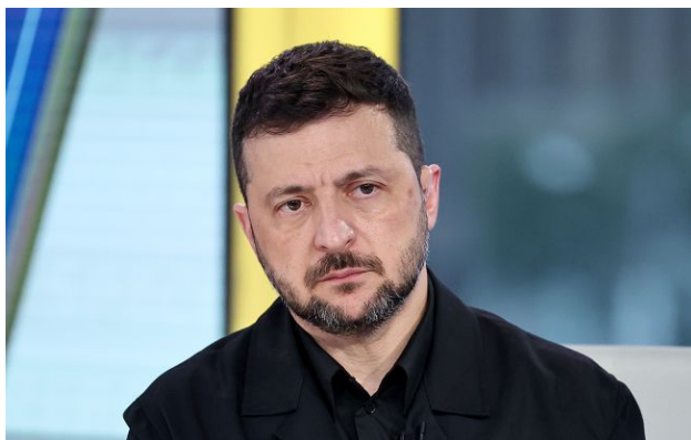
Фото: Володимир Зеленський

Вихід України з Донецької та Луганської областей - це стратегічний програш українських Збройних сил. Водночас Росія не бажає закінчувати війну "у справедливому форматі".