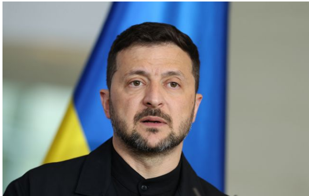
Фото: президент України Володимир Зеленський (Getty Images)

Україна веде переговори щодо розширення програми Drone Deal на нові регіони. Президент Володимир Зеленський натякнув, що серед них може бути Кавказ.