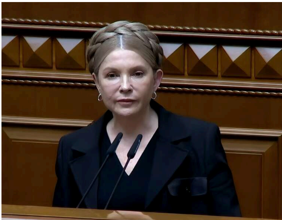
Справа без реєстрації в ЄРДР: Адвокати Тимошенко у ВАКС оскаржують законність підозри в підкупі депутатів

Вищий антикорупційний суд розпочав розгляд скарги захисту лідерки парламентської фракції "Батьківщина" Юлії Тимошенко на оголошення їй підозри у пропозиції надання неправомірної вигоди народним депутатам.