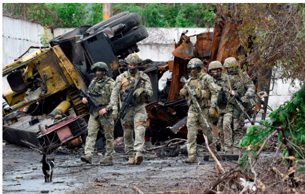
Фото: російські військові (Gettyimages)

Противник укотре спробував використати нестандартні шляхи та швидкісну техніку для проникнення в тил українських позицій, однак зіткнувся з підготовленою обороною.