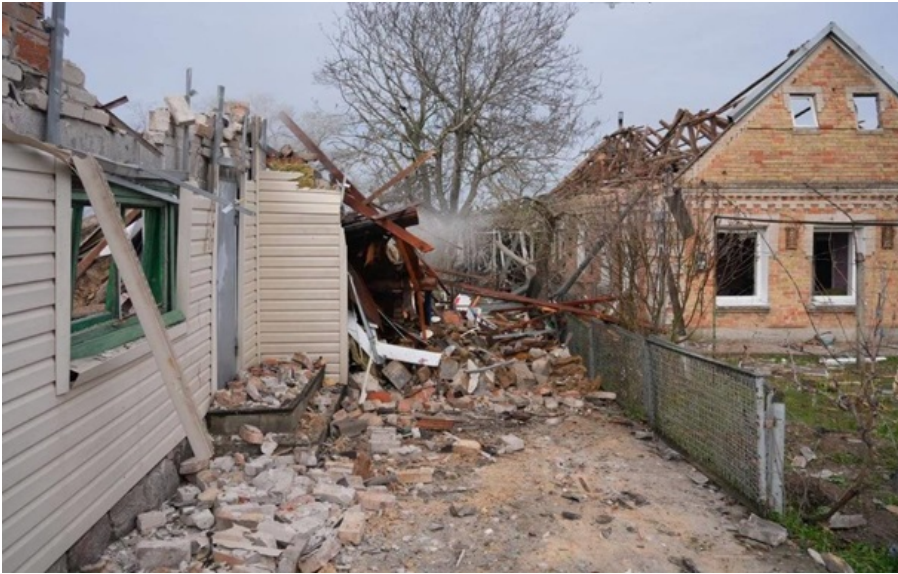
Наслідки російської атаки по селищу Балабине

Внаслідок російської атаки на Запоріжжя загинула одна та постраждали ще чотири людини.