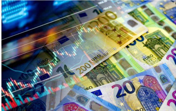
Фото: яким буде курс валют 21 квітня

Національний банк підвищив курс долара та євро на вівторок, 21 квітня. Європейська валюта вчергове встановила історичний рекорд.