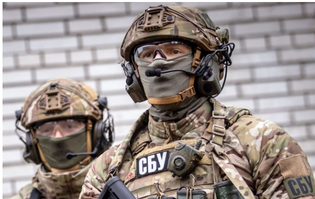
Фото: у Житомирі ліквідували ботоферму

У Житомирі затримали чоловіка, який щомісяця продавав Росії тисячі фейкових акаунтів у Телеграмі. Через них росіяни розганяли брехню про Україну та надсилали анонімні "замінування".