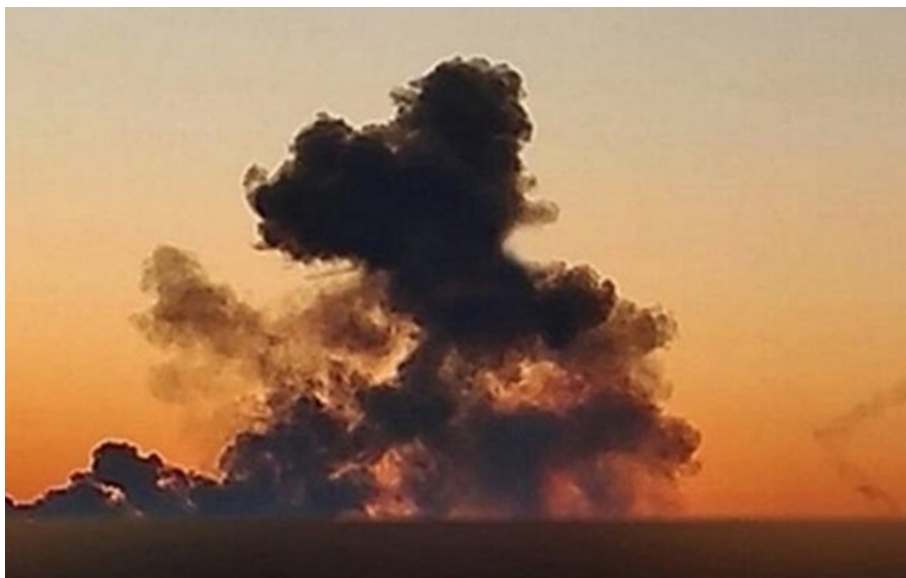
Під ударом могла опинитися військова авіабаза в районі міста Кримськ Краснодарського краю РФ

Щонайменше 20 вибухів прогрімало у районі міста Кримськ, де розташований військовий аеродром росіян.