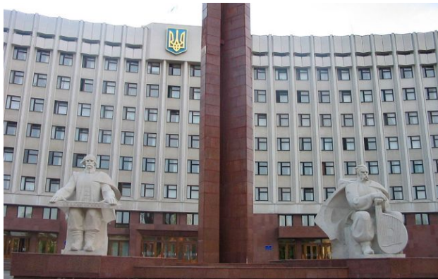
Франківська ОВА у центрі скандалу

В Івано-Франківській обласній військовій адміністрації сформувалася стійка модель обходу конкурентних закупівель. Понад 92% усіх угод у 2022-2026 роках на загальну суму 3,09 млрд грн було укладено через прямі договори, що дозволило залучати "потрібних" підрядників без відкритих торгів.