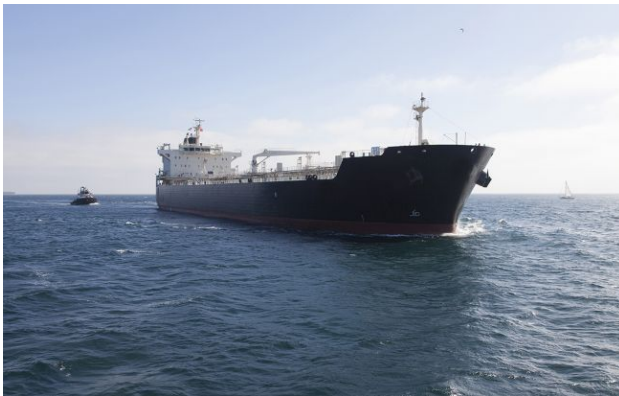
Фото: такнер з нафтою (Getty Images)

Ціни на нафту та природний газ різко зросли після того, як ВМС США захопили іранський корабель, чому передували обстріли європейських суден Тегераном та відновлення ним же контролю над Ормузом.