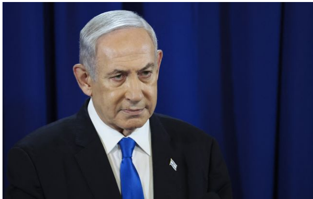
Фото: Біньямін Нетаньягу (Getty Images)

Зусилля США та Ізраїлю проти Ірану ще не завершені, а будь-який день може принести нові події.