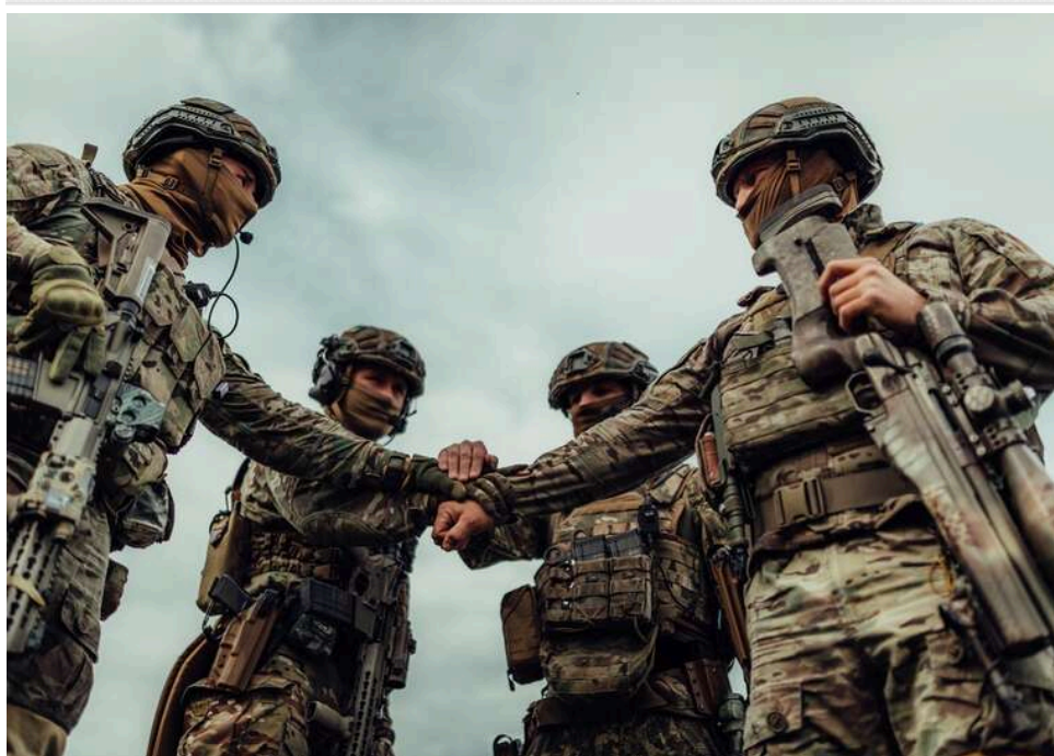
Ситуація на фронті: за добу сталося 166 бойових зіткнень, найгарячіше – на Покровському напрямку

Сьогодні, 19 квітня, станом на 22:00 сталося 166 бойових зіткнень. Найбільше боїв пройшло на Покровському напрямку.