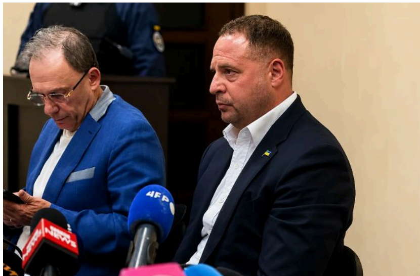
Фото: Андрій Єрмак, экс-голова Офісу президента (Тетяна Демух, РБК-Україна)