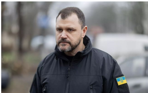
Фото: міністр внутрішніх справ України Ігор Клименко (mvs.gov.ua)

У мережі з'явилось відео, як поліцейські втекли від стрільця під час вчорашнього теракту у Києві і залишили цивільних без захисту. Буде проведено службове розслідування.