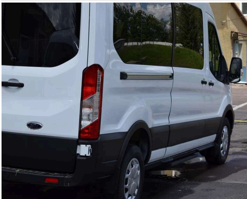
Адмінштрафу не буде: чому суд закрив справу про контрабанду в «подвійному даху» Ford Transit через БЕБ

Контрабанда сигарет «Duty Free Only» у подвійному даху Ford Transit: чому суд припинив справу проти водія.