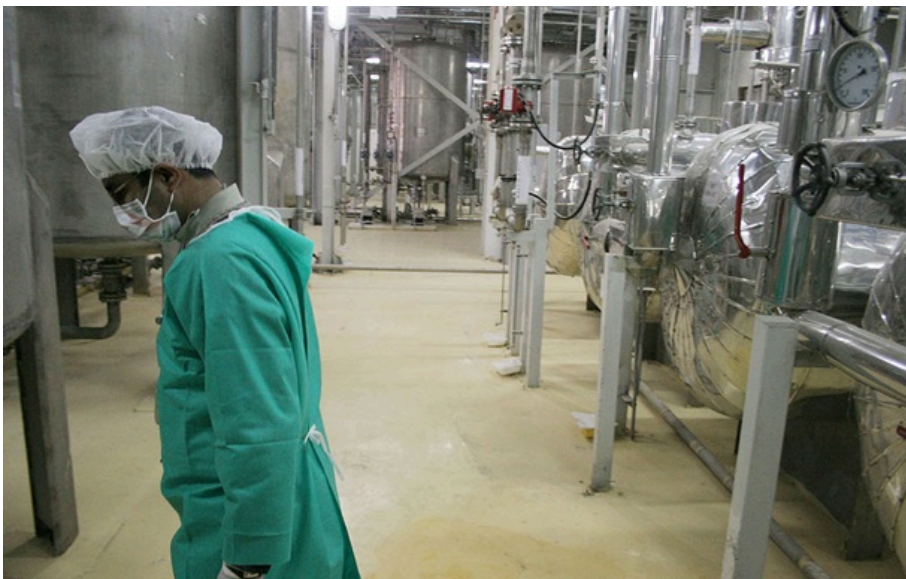
Іран пригрозив збагаченням урану до 90%

Іран ще має понад 400 кг урану, збагаченого до 60%, що є технічним кроком до збройового рівня в 90%.