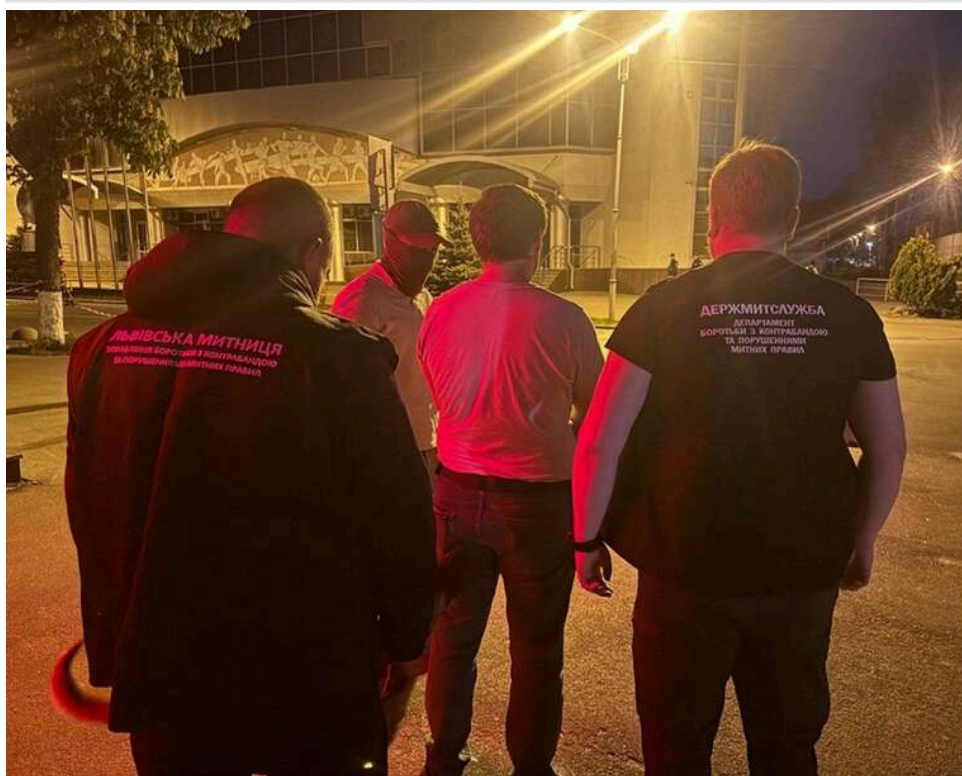
Зброя у посилках: митники перекрили міжнародний канал постачання комплектуючих до гвинтівок та набоїв