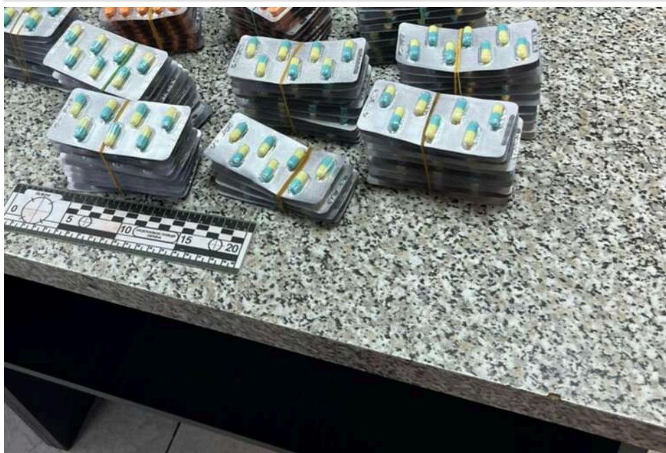
Сировина для «айсу» під виглядом ліків: як через український кордон масово завозять прекурсори з Єгипту

Українські суди розглядають щорічно сотні практично ідентичних адміністративних справ про порушення митних правил. У кожній з них фігурують одні й ті ж препарати єгипетського виробництва, що містять псевдоефедрин – контрольований прекурсор, який використовується для виготовлення метамфетаміну – наркотик, знаний як айс.