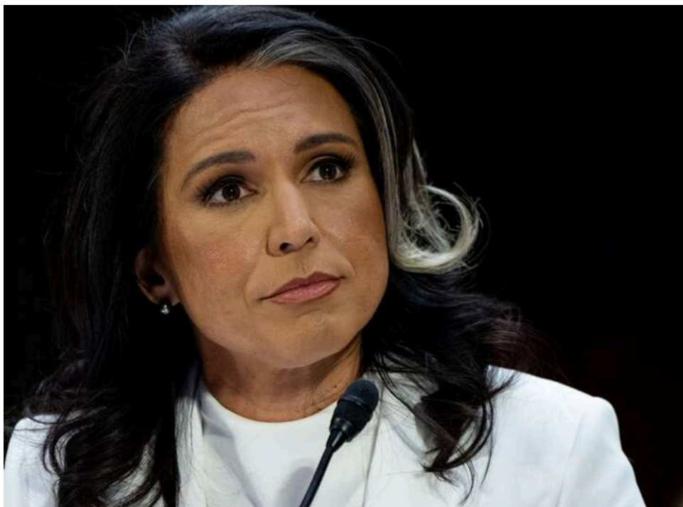
Тулсі Габбард анонсувала розслідування щодо біолабораторій в Україні

Директор національної розвідки США Тулсі Габбард заявила, що відомство розпочне розслідування американських біолабораторій, включно з тими, що розташовані в Україні.