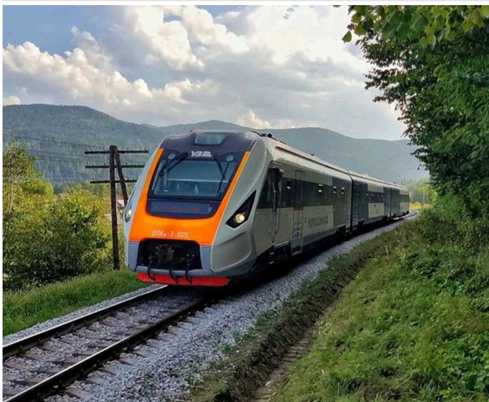
Укрзалізниця перегляне вартість квитків: подорожчає лише «люкс» та 1 клас «Інтерсіті»

Вартість окремих квитків для пасажирів Укрзалізниці буде змінена.