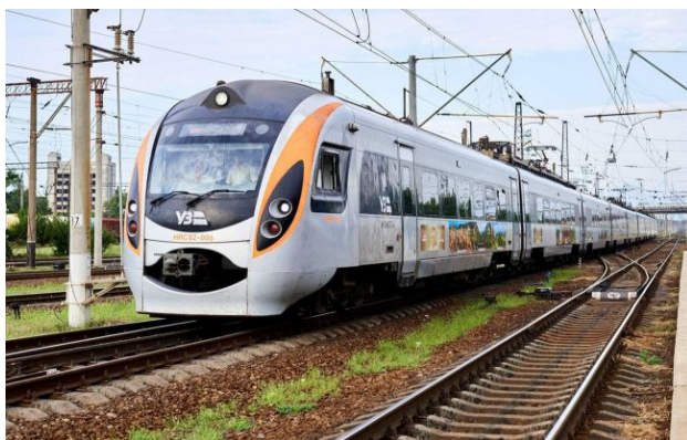
Фото: деталі інциденту будуть розслідувані

У суботу вдень, 18 квітня, у Вінницькій області зіткнулися тепловоз та поїзд "Інтерсіті+", в якому було майже 600 пасажирів. Наразі за ними їде підмінний поїзд.