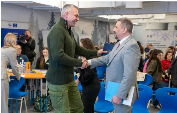
Віталій Кличко на Громадській асамблеї за участі фахівців Ради Європи

В Києві розпочала роботу Громадська асамблея за участі фахівців Ради Європи, де будуть сформовані рекомендації щодо підтримки ветеранів, ветеранок та їхніх сімей, які в подальшому втілюватиме міська влада.