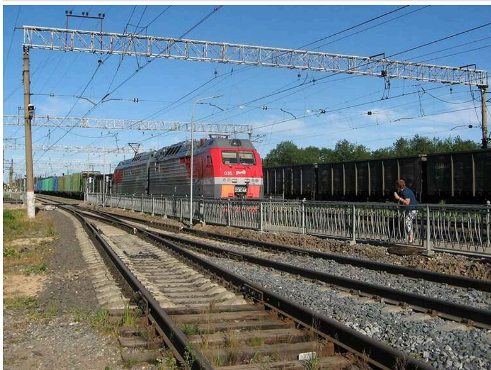
Диверсія в окупованому Луганську: агент «АТЕШ» спалив підстанцію, що живила залізницю

У Луганську внаслідок диверсії виведено з ладу підстанцію, що живила залізничний вузол постачання військових вантажів.