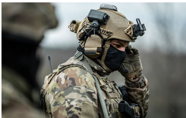
Фото: бійці ГУР провели серію рейдів на Запорізькому напрямку

Спецпризначенці ГУР провели серію успішних рейдів на Запорізькому напрямку. Знищили позиції та живу силу ворога.