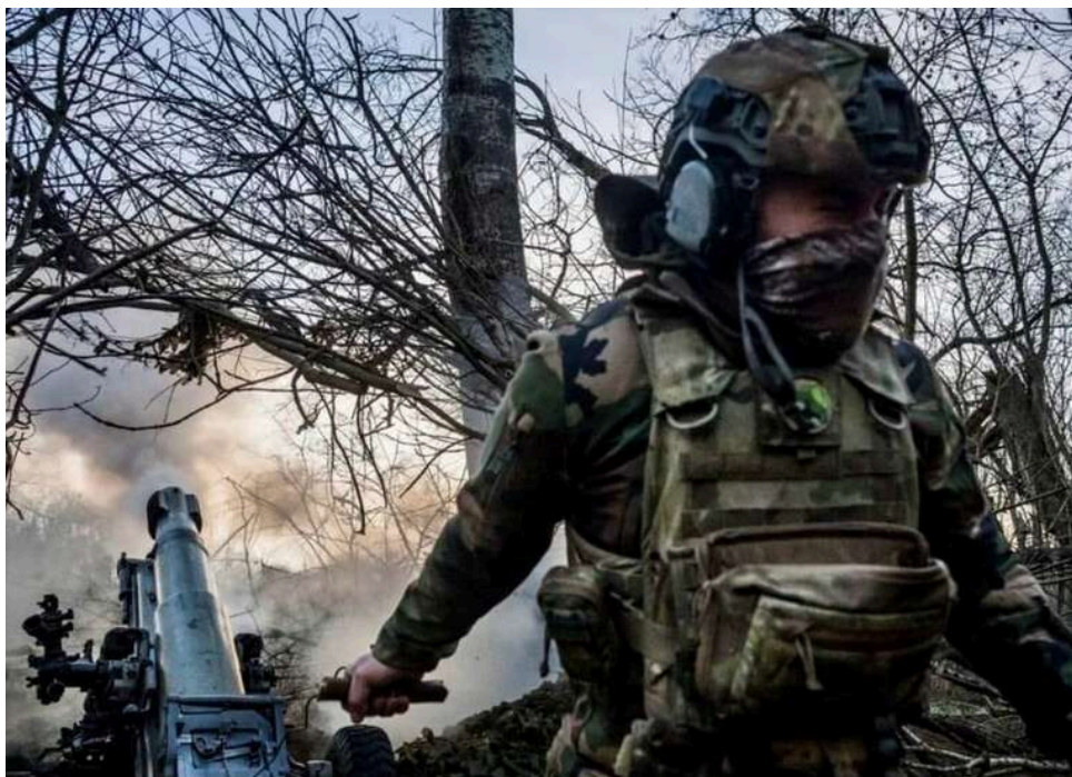
Ситуація на фронті: зафіксовано 151 бойове зіткнення за добу, Генштаб повідомив про найгарячіші напрямки фронту

Розпочалася 1515-та доба широкомасштабної збройної агресії рф проти України. Загалом протягом минулої доби на фронті зафіксовано 151 бойове зіткнення.