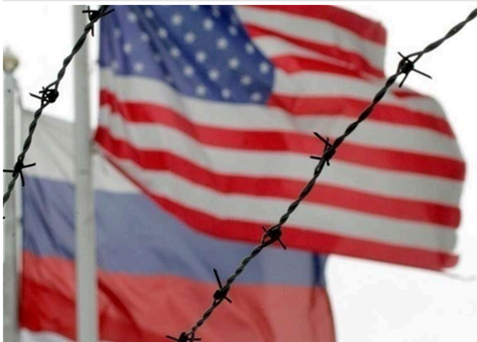
США продовжили послаблення санкцій на російську нафту до 16 травня