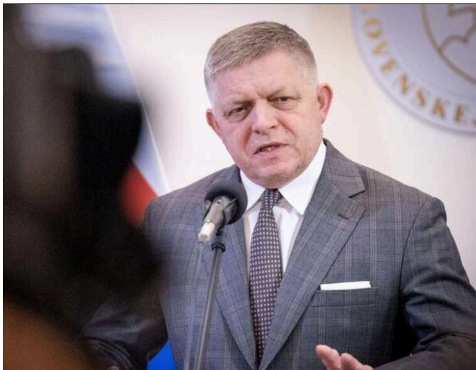
Словаччина оскаржить у суді заборону ЄС на імпорт російського газу, – Фіцо

Словаччина найближчими днями подасть позов, що оскаржує рішення Європейського союзу про заборону імпорту російського газу, ухвалене кваліфікованою більшістю голосів.