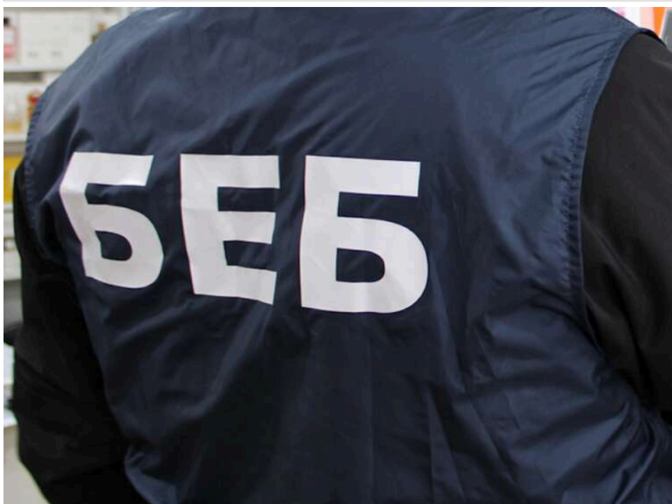
Збитки на мільйони: БЕБ ліквідувало мережу нелегальних АЗС в Одеській області

В Україні 2025 року було виявлено і демонтовано 76 незаконних АЗС. У 2026-му ж ця робота продовжилася. Зокрема, в Одеській області було припинено роботу цілої мережі нелегальних заправок, на яких торгували пальним сумнівного походження.