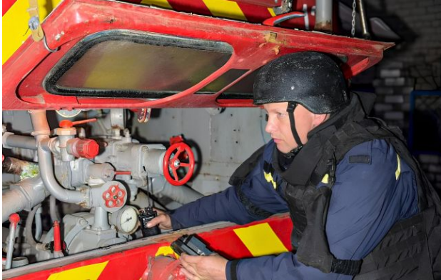
Фото: Горять будинки і дитсадок: як Росія "завершила" своє "перемир'я" з Україною (t.me/dsns)

Обирайте перевірене - додайте РБК-Україна до улюблених джерел у Google