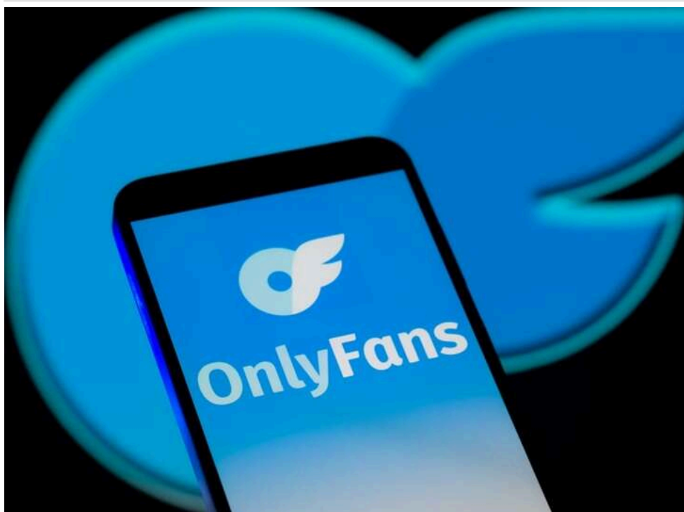
Суд у Львові стягнув майже 300 тисяч гривень податків з українки за доходи з OnlyFans

Львівський окружний адміністративний суд задовольнив позов податківців до фізичної особи щодо стягнення значної суми податкового боргу, що виник через незадекларовані іноземні доходи.