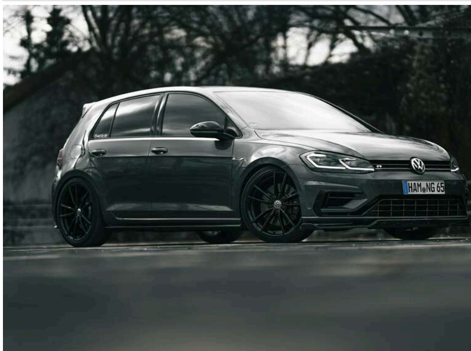
Українці в квітні імпортували майже 20 тисяч вживаних авто, – «Укравтопром»

Впродовж квітня український автопарк поповнився 19,6 тис. вживаних легкових автомобілів, імпортованих з-за кордону.