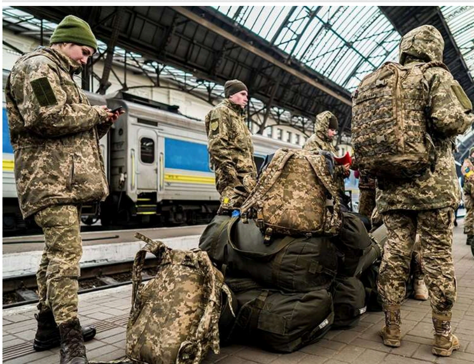
Мобілізація на довгу дистанцію: у Раді припустили можливість зниження призовного віку в разі ескалації

В Україні можуть зменшити вік мобілізації, оскільки війна триватиме ще довго.