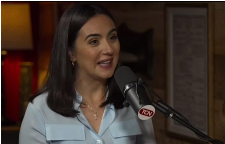
Юлія Мендель дає інтерв'ю Такеру Карлсону

В Офісі Президента відреагували на слова експресекретарки, зазначивши, що "ця пані давно не при собі".