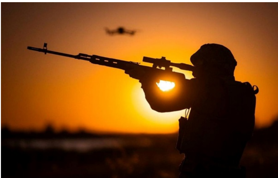
Фото: 23 ОМБр ЗСУ стримують російські атаки на сході і півдні України

Більше половини боїв підрозділів ЗСУ з окупантами зосереджено на Костянтинівському і Покровському напрямках.