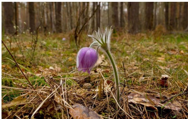
Фото: У Чорнобильській зоні відчуження зацвіла сон-трава (Денис Вишневецький)

У Чорнобильській зоні відчуження зафіксували появу сон-трави - рідкісної весняної рослини, занесеної до Червоної книги України. Фото рослини опублікували у Чорнобильському радіаційно-екологічному біосферному заповіднику.