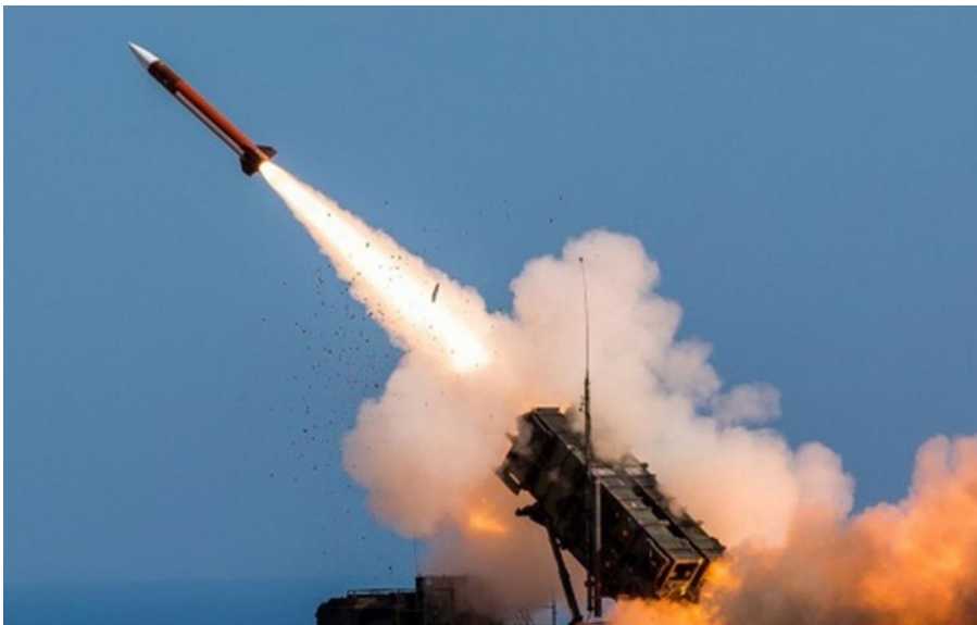
ЗРК Patriot

Йдеться про ракети-перехоплювачі PAC-3, яких в Україні лишилося лише кілька штук, у той час, як європейські союзники не поспішають ділитися власними запасами.