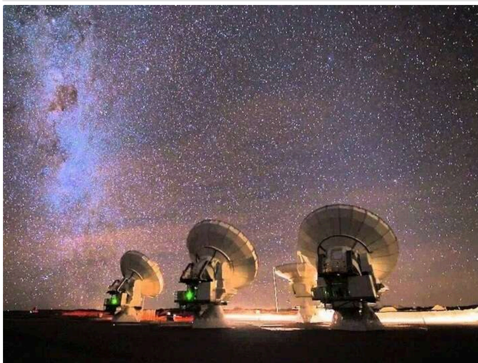
Латинська Америка переглядає наукові проекти з Китаєм на тлі геополітичного тиску

У Латинській Америці фіксується серія рішень про призупинення або перегляд великих наукових проектів за участю Китаю.