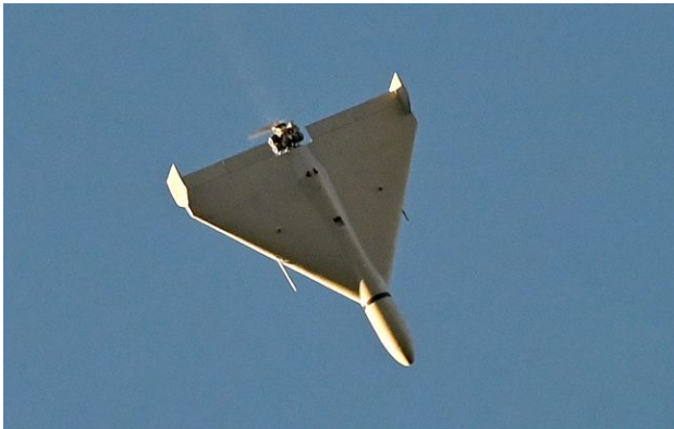
Фото: РФ випустили 20 "Шахедів" по підстанції на Житомирщині (Getty Images)

Російські війська здійснили масовану атаку на енергетичну інфраструктуру Житомирської області. Під ударом опинилася одна з підстанцій, яку атакували близько 20 дронів.