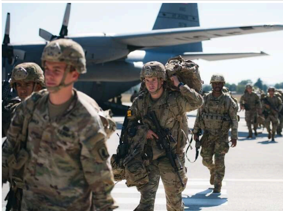
Балтійський щит: Латвія та Литва готові прийняти війська США, які виводять із Німеччини

Балтійські країни готові посилити свою безпекову роль у НАТО та прийняти додаткові американські війська на своїй території. Це може стати наслідком планів США щодо скорочення військової присутності в Німеччині.