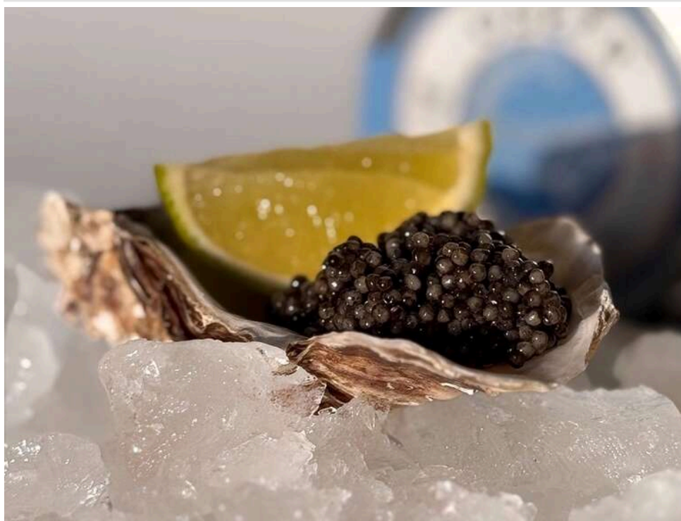
По 100 доларів за кілограм чорної ікри: на Одещині засудили митника за схему з делікатесами

Старший інспектор митного поста «Дністровський» на Одещині організував схему безперешкодного ввезення чорної ікри з Молдови.