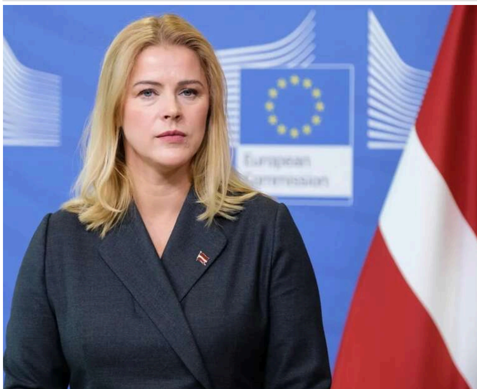
Відставка через дрони: прем'єрка Латвії Евіка Сіліня тимчасово очолить Міноборони

З 12 травня прем'єр-міністерка Латвії Евіка Сіліня тимчасово, до ухвалення подальшого рішення, виконуватиме обов'язки міністра оборони країни.