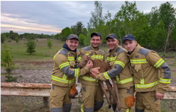
Рятувальники із лосеням

Маленьке лосеня потрапило в антидронову сітку й не могло вибратися самостійно. Поруч увесь час залишалася мама.