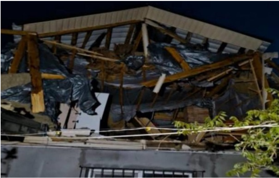
Наслідки атаки

Під час "перемир'я" росіяни завдали удару по Запорізькому району. Під ударом опинилися приватні будинки.