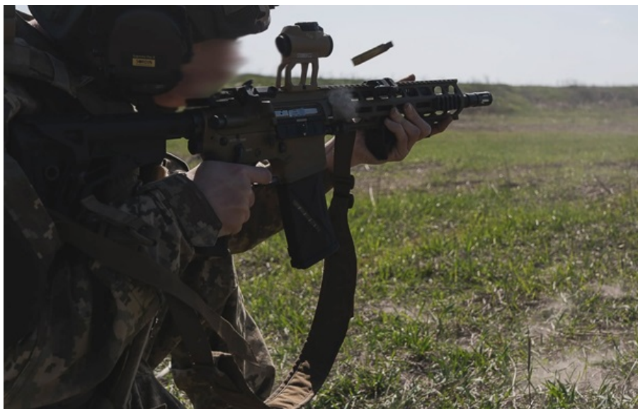
В Генштабі розповіли про ситуацію на фронті

На фронті відбулося 60 атак російської армії, тривають важкі бої на кількох напрямках, повідомили в командуванні.