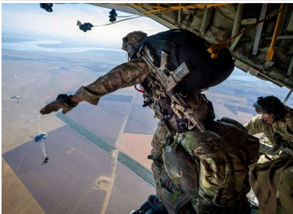
Армія Великої Британії вперше десантувала медиків для гуманітарної місії, - CNN

Військові медики армії Британії десантувалися на віддалений атлантичний острів Трістан-да-Кунья, щоб надати медичну допомогу громадянину Великої Британії з підозрою на зараження хантавірусом.