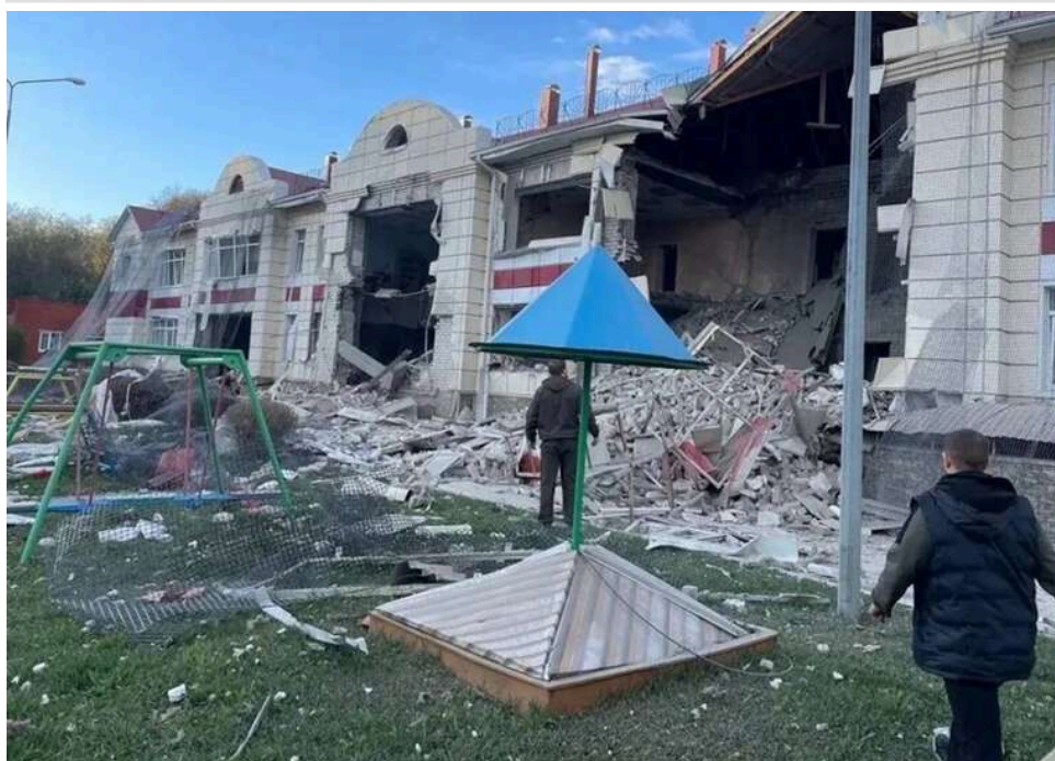
Обстріл школи в Іллінівці: ворог цілеспрямовано б'є по соціальних об'єктах на Костянтинівському напрямку