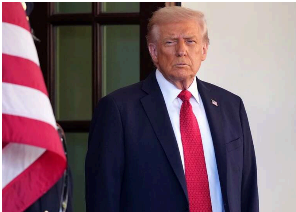
Трамп особисто дозволив Зіобро в'їзд до США всупереч позиції Держдепу, – ЗМІ

За даними Wyborcza, Збігнев Зіобро разом з дружиною Патрицією Котецькою опинився в США, оскільки отримав американську візу. Рішення про її видачу особисто ухвалив президент Дональд Трамп – попри заперечення держсекретаря США Марко Рубіо та посла США в Польщі Тома Роуза.