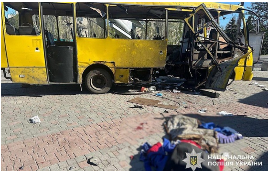
Пошкоджена маршрутка в Нікополі

Кількість жертв удару російського дрона по звичайній маршрутці зростає до чотирьох осіб, а число поранених - до 16, зазначив президент.