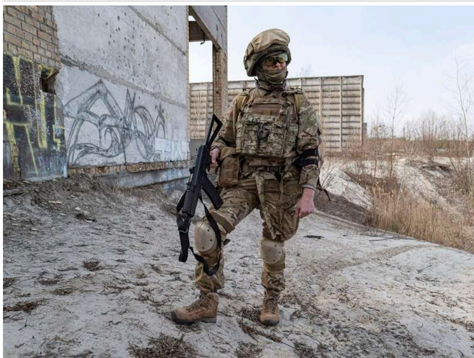
Ситуація на фронті: Зафіксовано 147 бойових зіткнень, найгарячіші напрямки Покровський, Костянтинівський і Гуляйпільський

Загалом за минулу добу, 9 травня 2026 року, на фронті зафіксовано 147 бойових зіткнень.